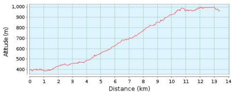
Profilo altimetrico (386 m a 997 m)